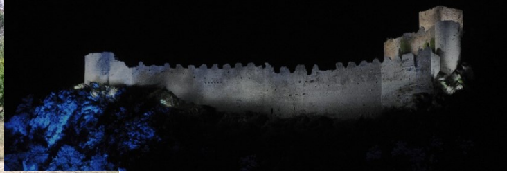
Fig.1. Il complesso di Greccio rappresenta un esempio interessante di relazione tra ambiente costruito e naturale. Il progetto illuminotecnico vuole valorizzare la componente naturalistica, fortemente connessa con la morfologia del Santuario e con la figura di San Francesco, con proiezioni che alludano alla luce lunare.