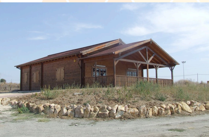
FIGURE PROFESSIONALI COINVOLTE

Il progetto si avvale della collaborazione tecnico-scientifica dell'ISPRA (Istituto Superiore per Protezione e la ricerca Ambientale), dell'ARSIAL (Azienda Regionale per lo Sviluppo e l'Innovazione dell'Agricoltura del Lazio) e dell'IZS-LT (Istituto Zooprofilattico Sperimentale delle Regioni Lazio e Toscana).