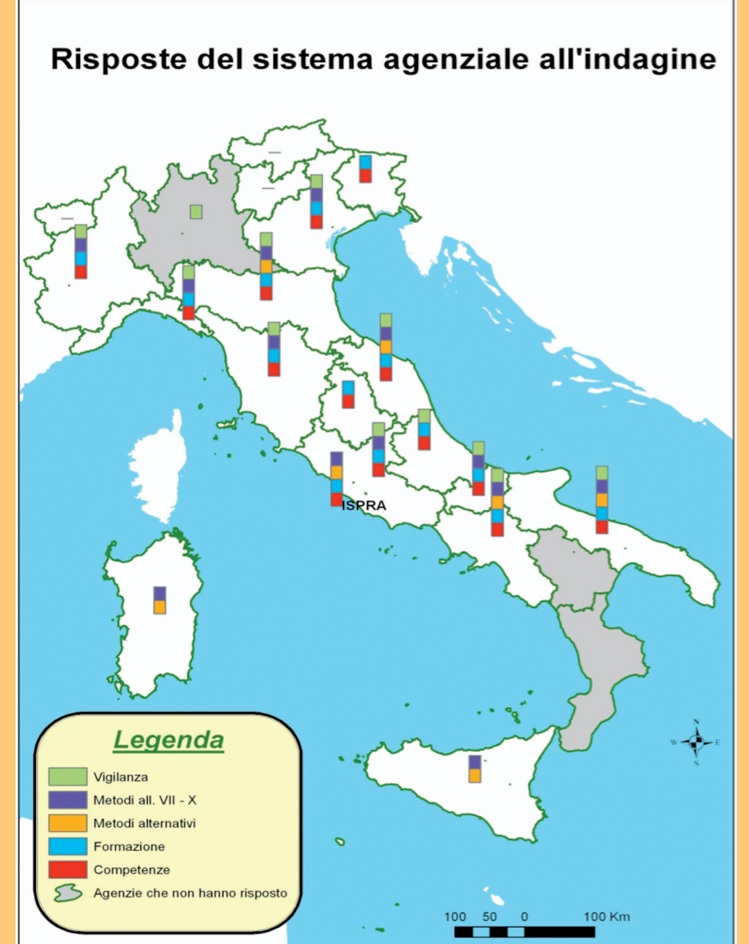
Figura 1: mappa delle risposte del sistema agenziale all'indagine REACH

L'indagine ha analizzato le competenze e le attività di formazione/informazione svolte. Oltre all'Istituto, che opera come organismo tecnico-scientifico di supporto al Ministero della salute (Autorità Competente per il REACH), esiste una capacità diffusa nel sistema per alcuni dei temi relativi alla valutazione della sicurezza chimica. Gran parte delle strutture agenziali che hanno risposto all'indagine hanno svolto formazione concentrata principalmente su aspetti normativi, vigilanza e scheda dati di sicurezza. Dall'indagine emerge l'importanza della formazione, finora svolta prevalentemente sulla base di iniziative autonome, spesso necessarie per dare risposte pronte ai problemi presenti nelle singole realtà territoriali, ma che dovrebbe essere meglio pianificata in un'ottica di sistema in modo da colmare complessivamente le lacune presenti e armonizzare il livello di competenze per l'attuazione della normativa sulle sostanze chimiche.