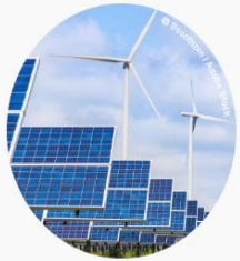
Renewable Energy Directive