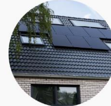
Energy Performance of Buildings Directive