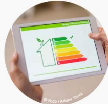
Energy Efficiency Directive